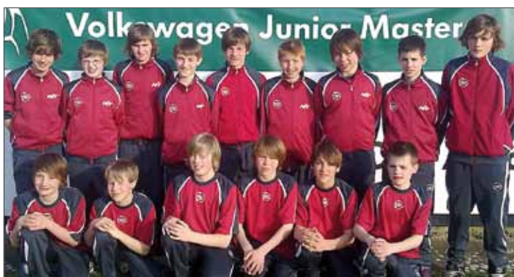
Die U13 spielt erfolgreich in der Vorrunde. Am Ende belegt die Mannschaft Platz 11.