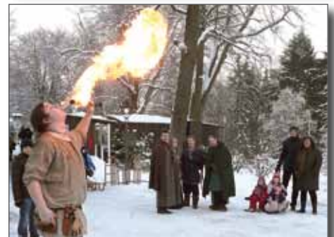
Titel-Fotos vergangener WIR-OCHTERSUMER-Ausgaben.